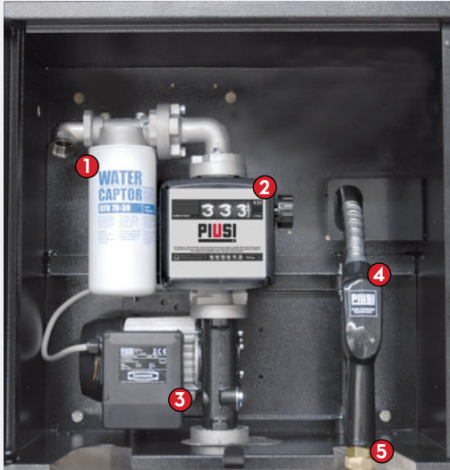
ST BOX Basic